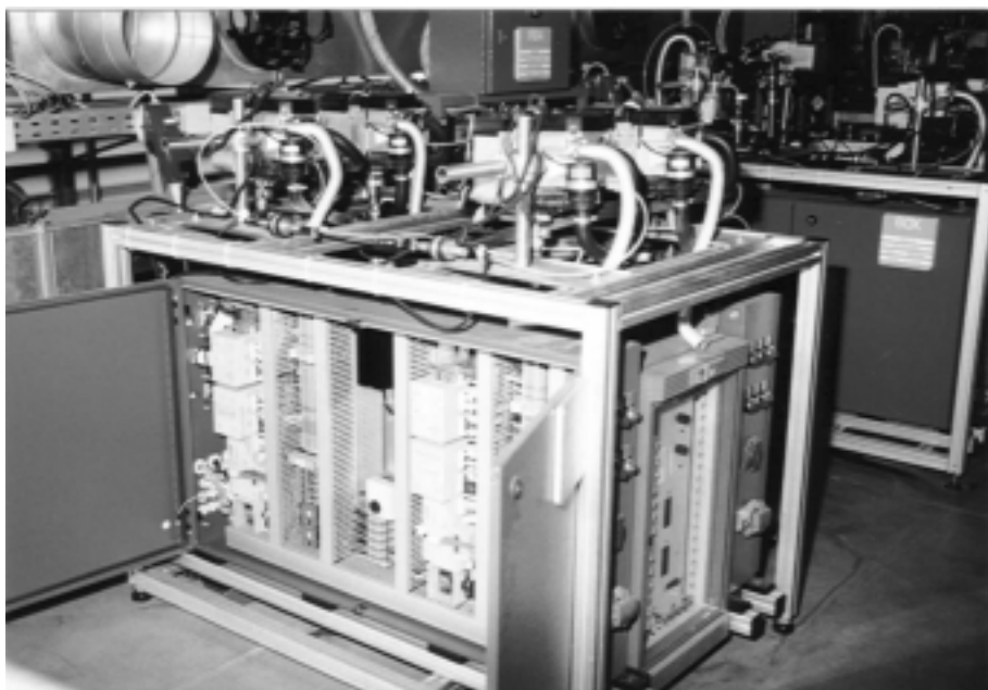
Der Prüfstand für Heizgeräte: Von insgesamt 140 Heizgeräten werden die Kenndaten über das Profibus-Netz eingesammelt; die Steuerungen in den Tischunterbauten überwachen und steuern die auf den Tischen montierten Heizgeräte.

Webasto, Lieferant von Heizgeräten für Automobile, ließ sich für differenzierte Prüfaufgaben einen speziell zugeschnittenen Prüfstand entwickeln. Der schnelle Blick in den Schaltschrank im Unterbau lässt eine Micro-SPS vermuten – weit gefehlt: Die Steuerung des Prüfstandes basiert auf einem modular aufgebauten Einplatinenrechner. Er ist wie eine Micro-SPS im rauen Industrieumfeld einsetzbar, zeigt aber an VMEbus-Technik angelehnte Funktionalitäten.